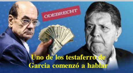
Uno de los testaferros de García comenzó a hablar

El Tercer Juzgado de Investigación Preparatoria libró la orden de aprehensión preliminar por diez días en contra de Kuczynski, por el delito de lavado de activos, por su presunta participación en el desvío de recursos en el caso de la empresa brasileña Odebrecht.