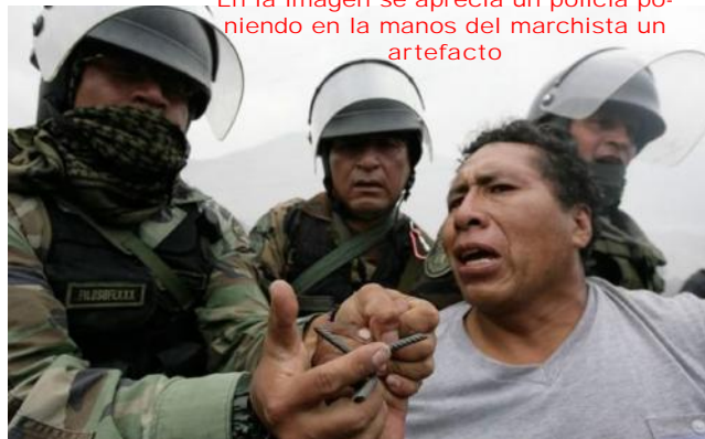
En la imagen se aprecia un policía poniendo en la manos del marchista un artefacto