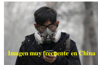
Imagen muy frecuente en China

Para hacernos una idea, en la actualidad la media anual de Beijing es de 86 micras por metro cúbico y de 62 la conjunta de todas las urbes del país, frente a las 55 micras apuntadas en el estudio. Sin embargo, un aire aceptable rondaría los 25 y para que fuese óptimo la concentración de PM 2,5 no debería superar las 10 micras por metro cúbico. Estos últimos días, la capital ha alcanzado hasta 620 micras por metro cúbico y en Xinxiang, en la provincia de Hunan, se alcanzaron 727. Por lo tanto, si 25 micras son la barrera de salubridad establecida por la OMS, estas cifras son más de 200 veces superiores. Cuando las cifras hablan por sí solas, sobran los comentarios.